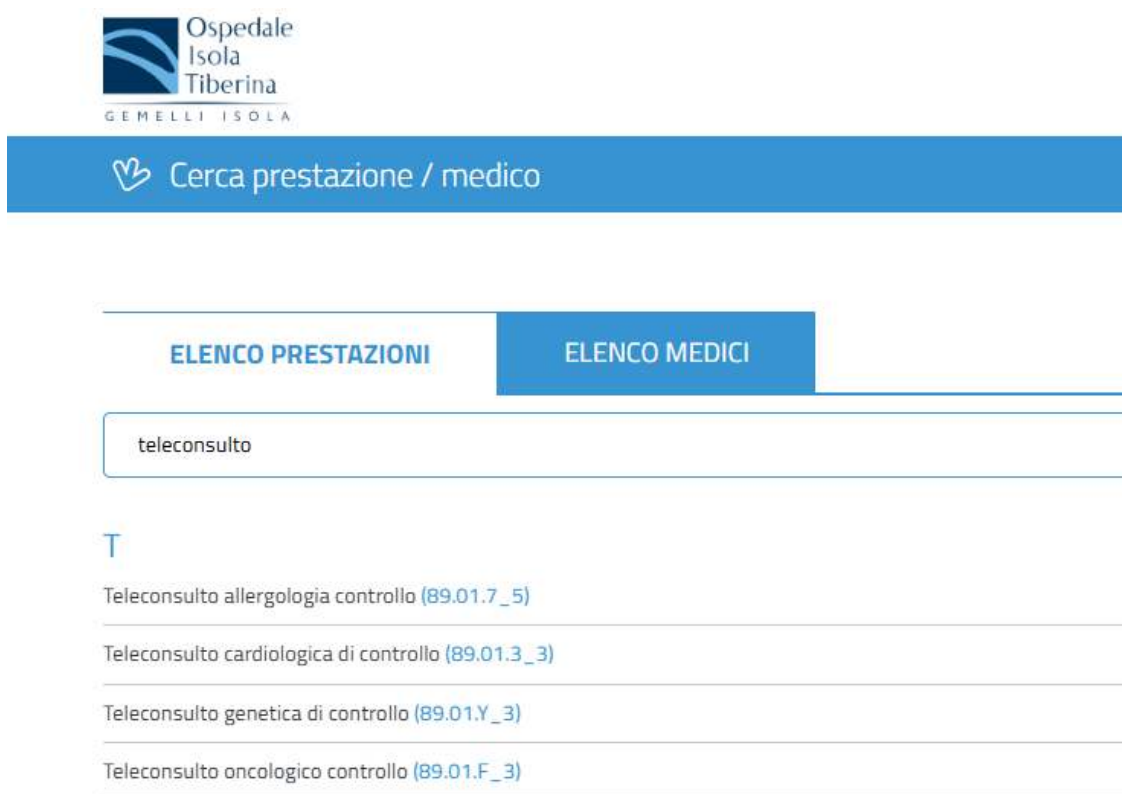
Figura 1 – esempio prenotazione online

E' possibile prenotare un teleconsulto tramite i consueti canali di prenotazione per la Libera Professione, indicati al link https://www.ospedaleisolatiberina.it/prenotazioni/liberaprofessione/ . Qualora decidesse di prenotare la prestazione in autonomia Online, inserisca la parola "teleconsulto" nella barra di ricerca dell'elenco prestazioni come rappresentato nell'immagine sottostante: