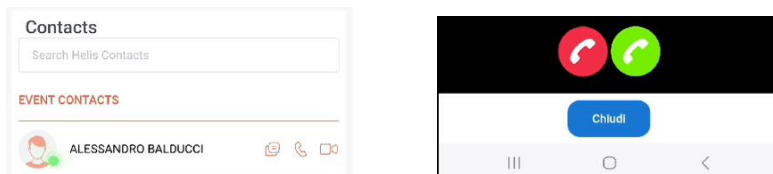
Figura 6 - avvio del teleconsulto